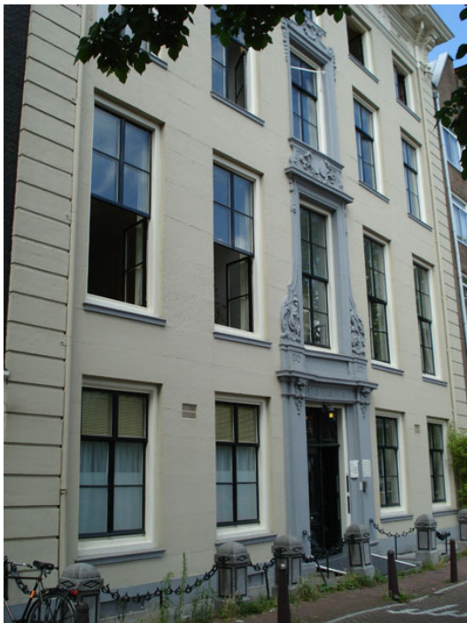
Nieuwe Herengracht 143 na renovatie gesplitst in meerdere appartementen.

inmiddels aan de Hugo de Grootkade gebouwde verpleeghuis De Poort ondergebracht in de 'Gereformeerde Stichting voor de verpleging van bejaarden en langdurig zieken'. Momenteel maken de opvolgers van dit, nu voormalige, tehuis deel uit van de Zorggroep Amsterdam.