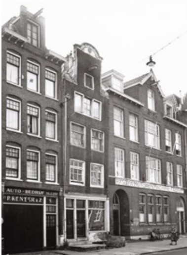
Hooft Kadijk 34 - 36; het middelste pand