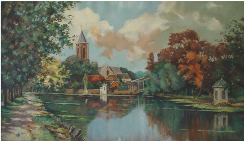
Loenen aan de Vecht, geschilderd door Cor de Leeuw 1959

naar Londen vertrok. Op de gezinskaart die in de gemeentelijke administratie van Amsterdam is opgenomen staat achter de vermelding van het huwelijk de datum 8 augustus 1918. Blijkbaar is Cornelis inmiddels weer in Nederland teruggekeerd. Per 6-8-1914 is hij formeel weer terug. Dit is een opmerkelijk tripje, zo tijdens de eerste wereldoorlog. Weliswaar was Nederland destijds neutraal, maar een reis over de Noordzee was in die jaren niet ongevaarlijk. Mogelijk kreeg hij de gelegenheid om met zijn broer Frans mee te varen.