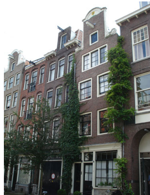
Nummer 36 in 2007; 34 & 36 samengevoegd.

In 1895 gingen zij verhuizen binnen dezelfde straat naar 34. Hoogstwaarschijnlijk zijn de nummers 34 en 36 samengetrokken tot één